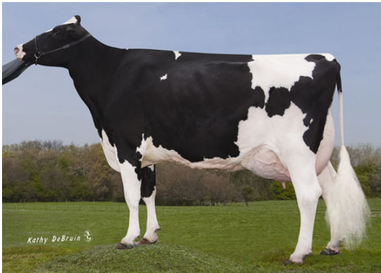
GLORYLAND-LB LINETTE RAE THIRD DAM